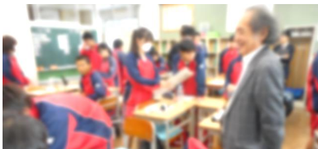
班で出たアイデアに思わず笑顔！

野比中学校では4人のグループでの学びが中心となっていますが、そこで行われる学びは「4人で協力して、助け合う」ということでは、全くないわけではないけれど、ちょっと物足りないのです。さらに付け加えて「4人の善さを発揮して、いろいろな気付きを出し合い、新しい考えや発想を生み出していく」というものにしていきたいのです。こうした学びの姿が「協同的な学び」になっていくのですね。単に助け合うわけではないので、4人の中では「教え合い」ではなく「学び合い」が重視されますし、「話し合う」というよりもみんなの考えを「聴き合う」関係が大切になってくるのです。