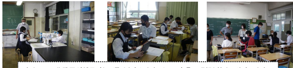
各カラーの作戦団が種目ごとに選手を考えます。クラス全員の理解と協力で決定します。

昨年の3年生が創ってくれた「NOBILYMPIC」。新たな野比中の伝統を継承します。さらによりよいものと3年生は取り組んでくれています。先日の定期テストのあと、作戦団と3年の応援団は午後、準備しました。体育の授業では、大縄の練習も行っています。密にならないために、各学級を3グループにわけると、各種目様々な工夫をして実施します。29日から始まる取り組み時間を有効に使って野比中の全校行事を成功させてください。