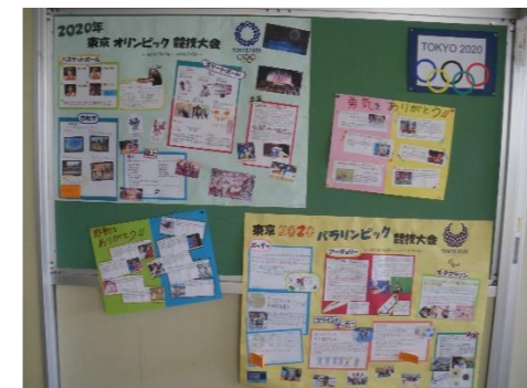
～5組によるオリンピック・パラリンピックの掲示物～ 一生懸命な選手の姿にたくさんの勇気をもらいましたね

中学校給食NEWSでも書かれていましたが、 給食時間の持ち物 について確認です。 【全員が持参】ハンカチまたはハンドタオル(給食前の手洗い用に清潔なものを)・マスク(朝からのもので可) 【給食当番の持ち物】 エプロン (胸当てのあるもの、腰巻型は不可)・ 三角巾 (髪を覆える大きさ)・エプロンと三角巾を入れる 袋