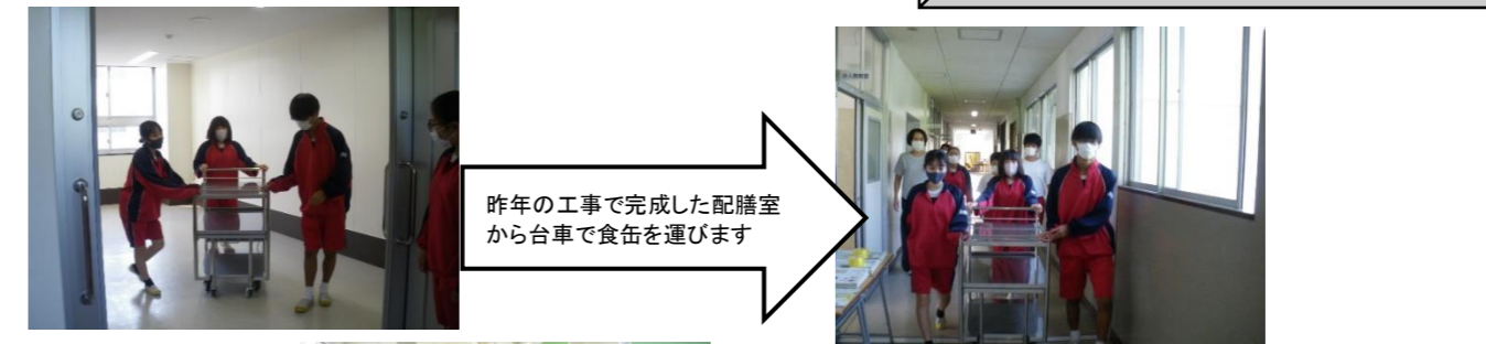
昨年の工事で完成した配膳室から台車で食缶を運びます

「食に関する正しい知識や望ましい食習慣を身に付ける」ために学校給食を実施します。丈夫な身体をつくるための大事な食事について、ぜひ関心を持ち、美味しく給食を食べてください。今は黙食だけど、マナーを守って楽しい時間にしてください。