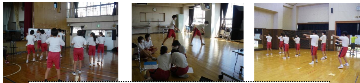
3年応援団による構想づくり。体育の授業で3年生全員が考えたものを形にします。

今年も体育の授業で創ったダンスを3年応援団を中心に全体の構想を確認し、3年生の体育の授業で完成させます。9月28日の結団式に続き、29日からはブロックでの練習が始まります。ダンス(今年の種目名は獅子奮迅～野比中魂2021)の練習だけでなく、競技の練習をしたり、各カラーの作戦団が計画をたて、3年生のリーダーを中心に授業時間が組み立てられます。全校で3年生を見本に、2年生が支え、1年生も一生懸命取り組む全校行事です。3年生にとっては、3学年の集団としての力を見せる大切な機会です。自分たちの思い出づくりとともに、野比中の伝統を後輩たちに伝えてください。