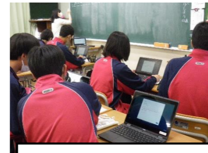
得意な生徒が教えてくれます

一人ひとりにIDが配付され、ログインし、さっそく使い始めました。先生方も得意な先生に教わりながら、授業でどのように活用するか検討しています。最初に確認したことを忘れずに、大切に使ってください。