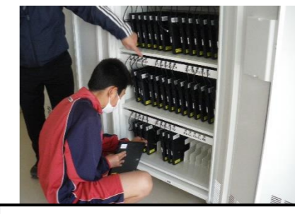
各フロアの充電ボックスから取り出します