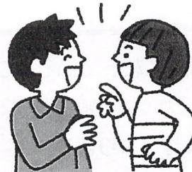
③間近で会話や 発声をする密接場面