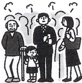
②多数が集まる 密集場所