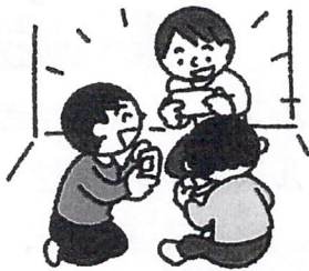
①換気の悪い密閉空間