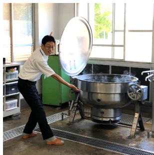
こんなに大きい窯が