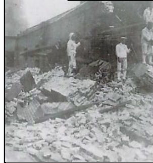
関東大震災での横須賀の被害写真 (校長室所蔵本から)