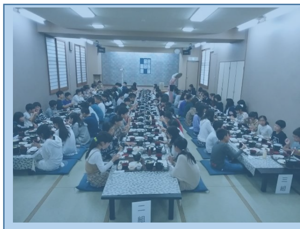
「夕ごはん 写真で見るとより 多かった」