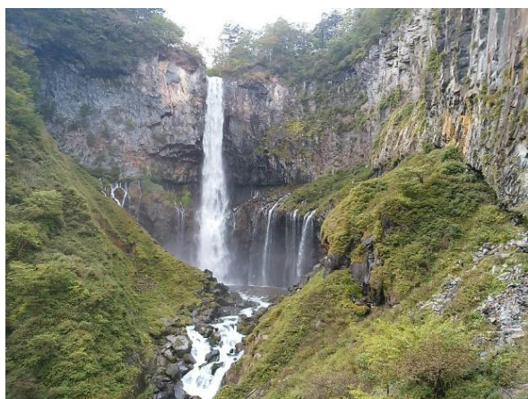
「大自然 華巖の滝で シカを見た」

前日、体育館で事前集会があり、6年生に向けて話したことは、上記の目的を達成するために自分たちで決めたスローガンとルールをしっかり守ること、そして、最後まで「フェアプレー」の精神を守ってほしいということです。全員が私の目を見て、しっかりと話しを聞いてくれていたので、大変たのしく思いました。