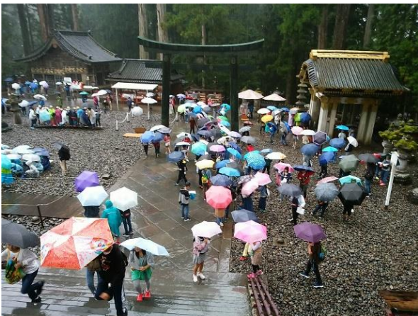
「二日目の 東照宮で びしょぬれだ」

6年生は、ホテル「春茂登」(はるもと)で楽しい夜を過ごし、全員揃って朝食をとりました。昨夜から雨が降り続けている中、徒歩で二社一寺方面へ出発。輪王寺では学年で、東照宮ではクラスで雨中の集合写真を撮影しました。その後、三猿～陽明門～眠り猫～奥社(家康の墓がある所)等々、班行動で世界遺産を巡りました。時折雨が強くなり、靴の中まで濡れてしまっても、励まし合って進んでいく様子に感激しました。東照宮～二荒山神社～大猷院(家光の墓所)の後、最終集合場所である宝物館に到着する頃、空が明るくなり始めました。冷えた体に少し辛めのカレーが効いたのか、みんな元気を回復しました。カレーのお代わりは行列が出来るほどでした。