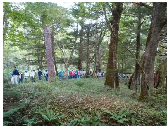
「湯滝だから 温かいと思ったら 手がこおる」

【日光川柳大会:校長賞作品】 ◇雲はしる 光が水に 反射する ◇修学旅行も フェアプレーで 楽しんだ