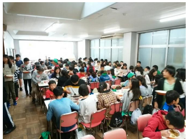
「修学旅行 福助のカレー 美味かった」