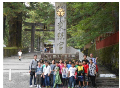
東照宮の石碑の前で