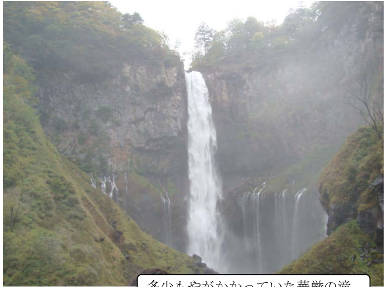
多少もやがかかっていた華厳の滝