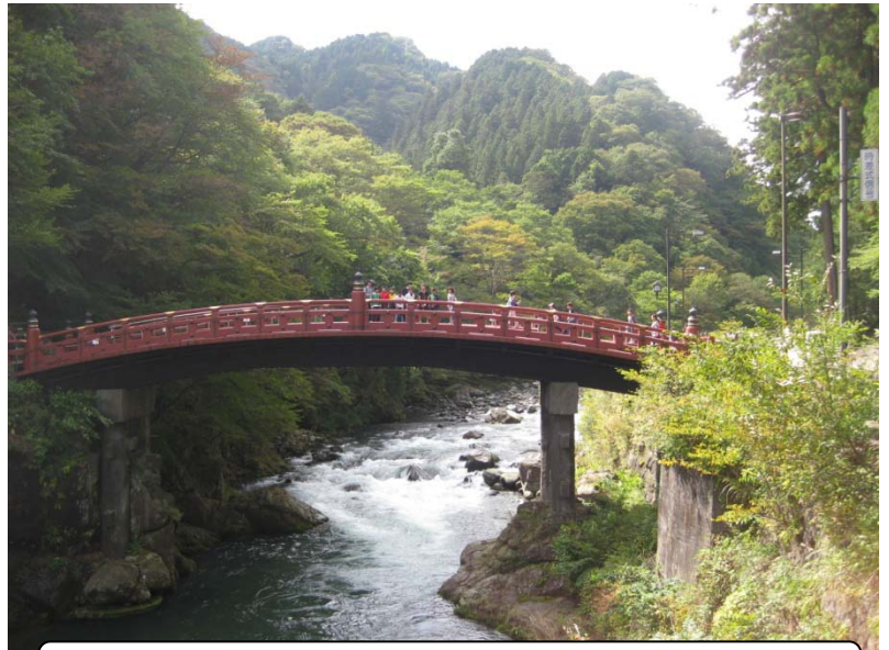
神橋を渡る子どもたち（ほとんど見えませんが・・・）