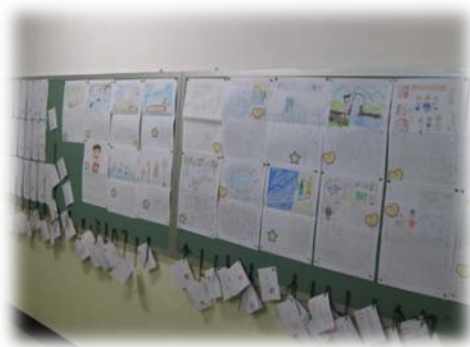
給食室前の廊下に掲示してあります。