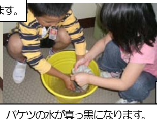
バケツの水が真っ黒になります。