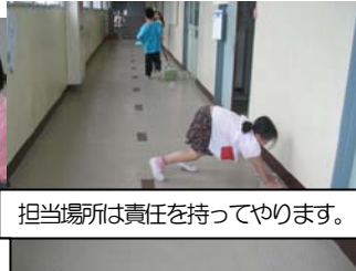
担当場所は責任を持ってやります。