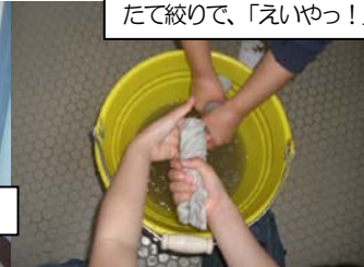
たて絞りで、「えいやっ!」