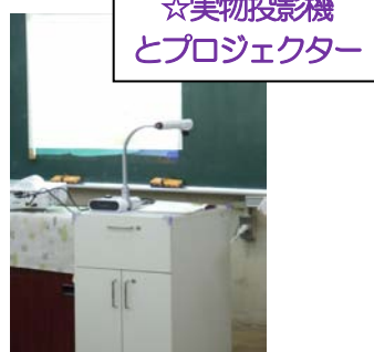
☆実物投影機とプロジェクター

国語辞典の小さな字なども、装置を使えばこんなふうに拡大して、クラス全員で見ることができます。