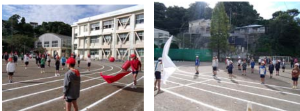
☆27日(水)1,2校時~全校練習で、応援合戦。全員でリレーコースの石拾いもしました。

お天気によっては予定どおりに行かないこともあるかもしれませんが、皆様のご理解・ご協力をどうぞよろしくお願いいたします。